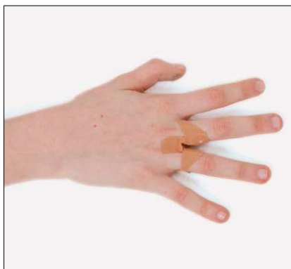
Zwischen den Fingern